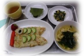
子どもの日大会の給食 “こいのぼりランチ”