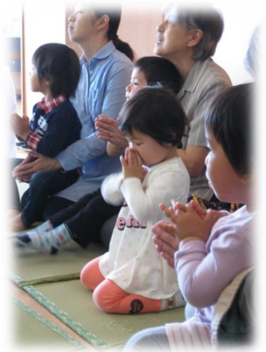
可愛らしく手を合わせる姿 小さい頃からの「敬う心」 大切に育てたいですね。